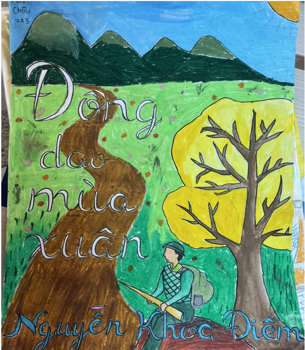
Tác phẩm văn học: Đồng dao mùa xuân - Nguyễn Khoa Điềm