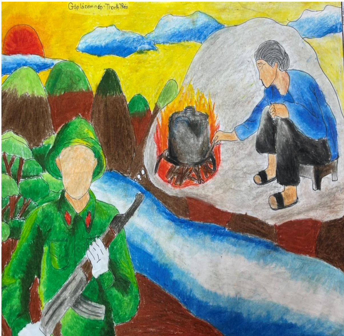
Tác phẩm văn học: Gặp lá cơm nếp Học sinh: Lê Thảo Phương - Lớp 7A3

Hay nổi nhớ thương mẹ của người con trong bài thơ “Gặp lá cơm nếp”. Bài thơ đã ghi lại cảm xúc của người con tình cờ nghĩ đến hương vị của mùi xôi và nhớ về mẹ. Tác giả đã xa nhà nhiều năm, thèm một bát xôi nếp mùa gặt và nhớ về mẹ cùng những hương vị yêu dấu của làng quê. Trong tâm hồn các anh, người mẹ là hình ảnh lớn lao nhất, đẹp đẽ nhất của quê hương. Với người lính, mẹ là suối nguồn của yêu thương, là ánh sáng diệu kì dõi theo con suốt cuộc đời.